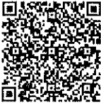
สิ่งที่ส่งมาด้วย